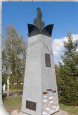
Monument des événements Uniques et heureux (Le Meuh)

Les balades de Fertrève vous permettent de découvrir tous les atouts paysagers de cette petite commune rurale : observation d'oiseaux d'eau, découverte de la magnifique forêt de Vincence bordée de prairies et de haies où coule une rivière, la Canne et son ruisseau, le Tramboulin.